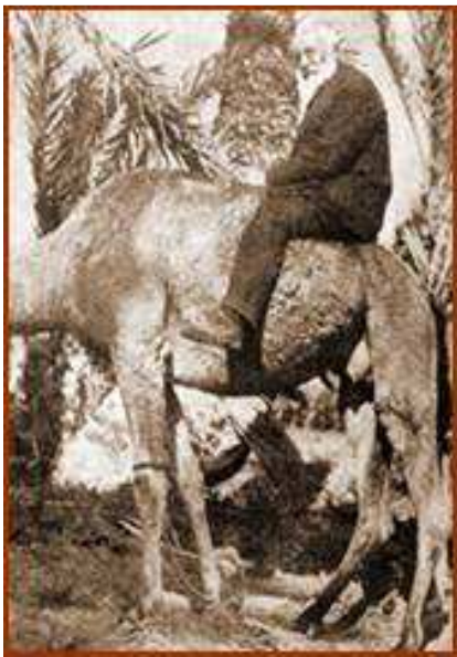
Miguel de Unamuno en Fuerteventura durante su destierro

Hablemos sobre Miguel de Unamuno en la película.